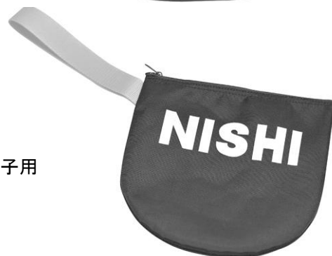
T5391B 円盤ケース女子用 レッド